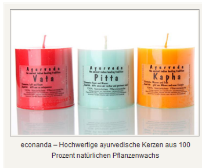
econanda – Hochwertige ayurvedische Kerzen aus 100 Prozent natürlichen Pflanzenwachs